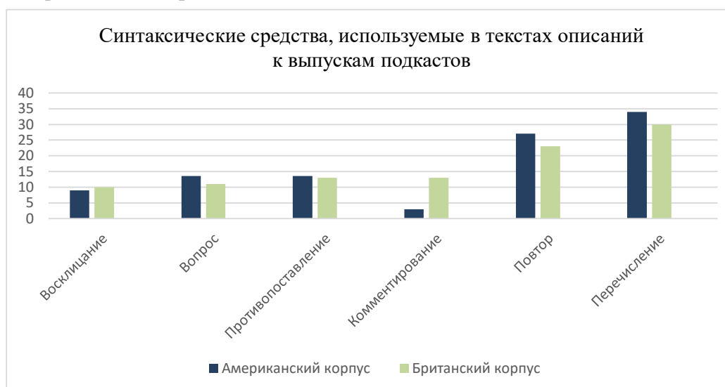
Рис 1. Синтаксические средства, используемые в текстах описаний к выпускам американских подкастов

Особенности употребления синтаксических средств в кратких текстах описаний к выпускам подкастов систематизированы на Рис. 1. Частота использования конкретного синтаксического средства в тексте была подсчитана в процентном соотношении от общего количества выявленных синтаксических средств, т.е. все обнаруженные в корпусе средства были суммированы и определены как 100%. Так, для американского корпуса 100% составило 59 синтаксических средств, а для британского – 53.